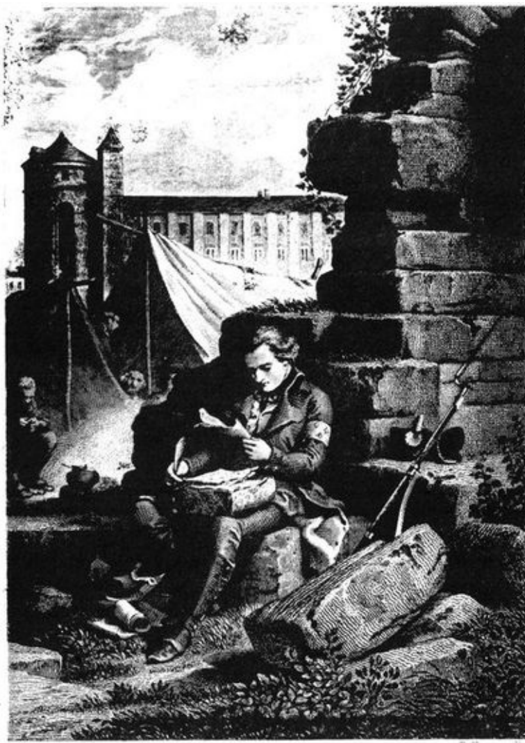
M. DE CHATEAUBRIAND à l'armée de Condé.