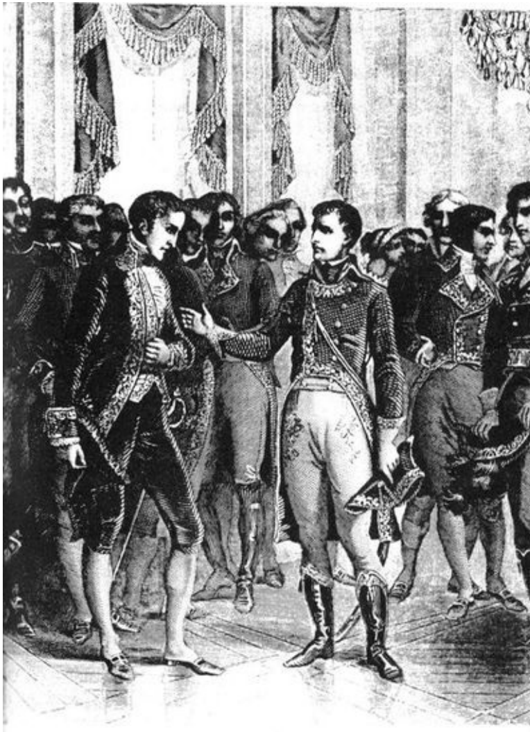
Soirée chez Lucien Bonaparte.

La littérature qui exprime l'ère nouvelle n'a régné que quarante ou cinquante ans après le temps dont elle était l'idiome. Pendant ce demi-siècle elle n'était employée que par l'opposition. C'est madame de Staël, c'est Benjamin Constant, c'est Lemercier, c'est Bonald, c'est moi enfin, qui les premiers avons parlé cette langue. Le changement de littérature dont le xix e siècle se vante lui est arrivé de l'émigration et de l'exil: ce fut M. de Fontanes qui couva ces oiseaux d'une autre espèce que lui, parce que, remontant au xvii e siècle, il avait pris la puissance de ce temps fécond et perdu la stérilité du xviii e . Une partie de l'esprit humain, celle qui traite de matières transcendantes, s'avança seule d'un pas égal avec la civilisation; malheureusement la gloire du savoir ne fut pas sans tache: les Laplace, les Lagrange, les Monge, les Chaptal, les Berthollet, tous ces prodiges, jadis fiers démocrates, devinrent les plus obséquieux serviteurs de Napoléon. Il faut le dire à l'honneur des lettres: la littérature nouvelle fut libre, la science servile; le caractère ne répondit point au génie, et ceux dont la pensée était montée au plus haut du ciel ne purent élever leur âme au-dessus des pieds de Bonaparte: ils prétendaient n'avoir pas besoin de Dieu, c'est pourquoi ils avaient besoin d'un tyran.