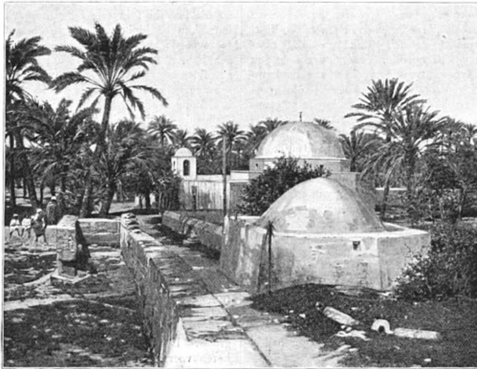
Chamsa-moskee in het Garianadal.

boven die uit Tripolis, en het ivoor, dat veelal uit Wadaï werd aangevoerd, gaat, sedert de spoorweg naar Khartoem klaar is, den Nijl af naar Alexandrië in plaats van met karavanen naar Tripolis en Bengazi.