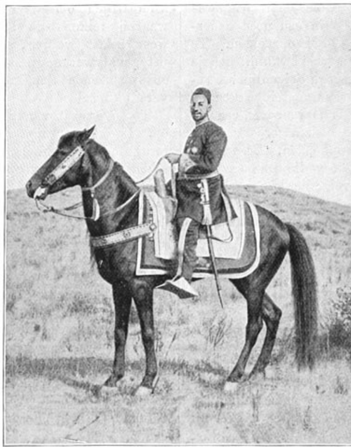
De moesjir van Kasr Karaboeli.