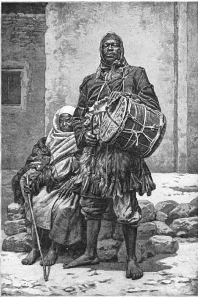
Goochelaar bij de Berbers.

Ik had daar op die plek een paar zware oogenblikken Bladzijde 398 in mijn leven.... Toen we ons gereed maakten, de eerste fotografieën te maken, weigerden de drie toestellen, die te veel geschud hadden op de ruggen der kameelen, den dienst. Zoo zouden wij dan beroofd worden van de kostbaarste documenten der geheele reis! Bij geluk kon Pepino, de vernuftige Pepino, de instrumenten herstellen en avond op avond ontwikkelden wij met levendige voldoening de uitstekendste cliché's.