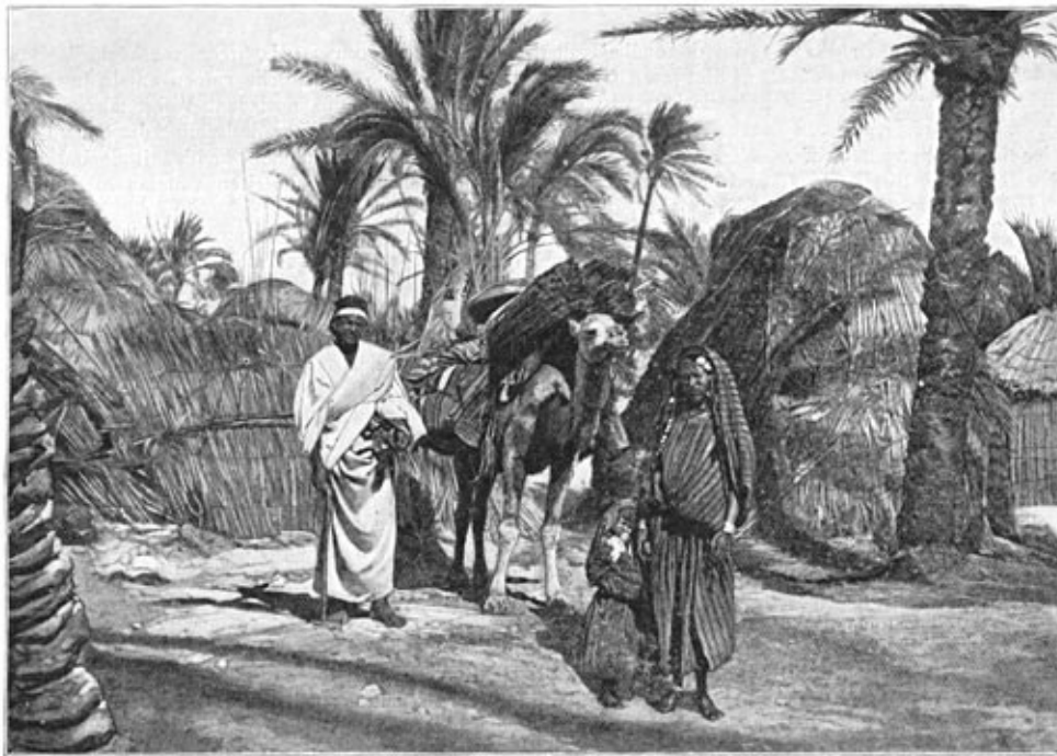
In de Boven-Soff ed Dimn.

Geheel Tahar, zooals men het binnenland van het groote plateau wel noemt, helt af naar het Zuiden. De helling begint al bij den noordrand, zoodat de grond aan de Middellandsche Zee snel daalt, terwijl de kant van de Sahara geleidelijk overgaat tot de hoogte van Rhadames en Sokna. Een andere helling is aan den oostkant, maar die is nog van minder beteekenis dan de eerste. De wadi's Soff ed Dimn en Zemzem, de groote waterbergplaatsen van de streek, zouden dus zich naar het Zuiden moeten richten; maar zij stuiten op reeksen kleine rotsen, evenwijdig aan die van de Djebels, waarlangs ze genoodzaakt zijn een abnormale richting in te slaan, die ze naar de golf der Groote Syrte voert. Om van Yffren naar Orfella te gaan is de rechte weg, en de eenige bruikbare vanwege het water, de bedding van een dezer wadi's, de Soff ed Dimn. Wij betraden die bedding op eenige kilometers afstands van Djendoeba, waar we ons ophielden, om interessante ruïnen te zien.