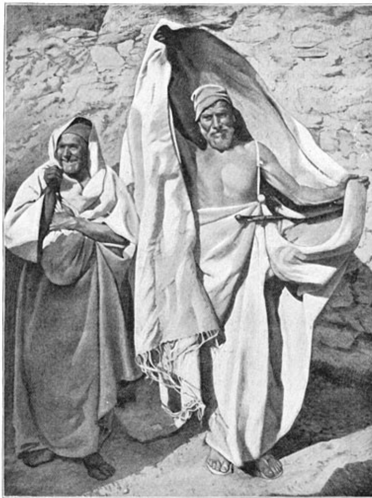
Berbers uit Nefzaoua.

Wij kwamen juist te Yffren, toen een nieuw bataljon het oude kwam aflossen, dat er sedert een jaar verblijf hield. Het stadje was in groote drukte. De grootste en bontste levendigheid heerschte rondom de vesting en in de café's van Tagrebost. De esplanade vóór de kazerne weerklonk van het gehinnik der duizend kameelen, welke de benodigdheden voor het nieuwe garnizoen hadden meegebracht. En dat alles gaf aan dit afgelegen hoekje in den verblindenden zonneschijn een vroolijkheid, die men er zelden zal treffen.