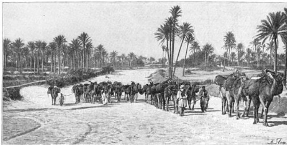
Karavaan op weg naar Rhadames.

Mijn eerste onderzoekstocht in Tripolis in 1901 was maar zeer onbetekenend geweest door opgekomen politieke moeilijkheden. Gelukkig heb ik daarna nog twee reizen kunnen doen, namelijk in 1903 en 1904, waarbij ik een veel uitgestrekter gebied heb kunnen bezoeken en meer op mijn gemak dit deel van Afrika heb bestudeerd, dat tot hiertoe nog zoo weinig bekend is. De onderzoekingen, in het geheele vilayet ingesteld, tot de streken, behoorend bij Fezzan, worden in dit verhaal weergegeven.