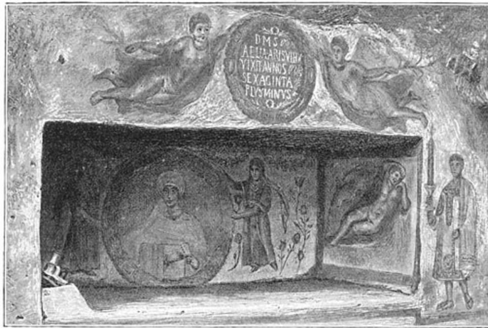
Antiek graf bij Gargaresj.

onwetendheid, waarin men verkeerde ten aanzien van Tripolis, wees van beide zijden deze streek aan als grens der verhuizingen van uit tegengestelde richtingen. De aanwezigheid van individuen van het blonde type is geheel berbersch. Tripolitanië zal de quaestie nog maar meer ingewikkeld maken, tot een of ander archaeologisch document, dat onbetwistbaar is, haar kome oplossen.